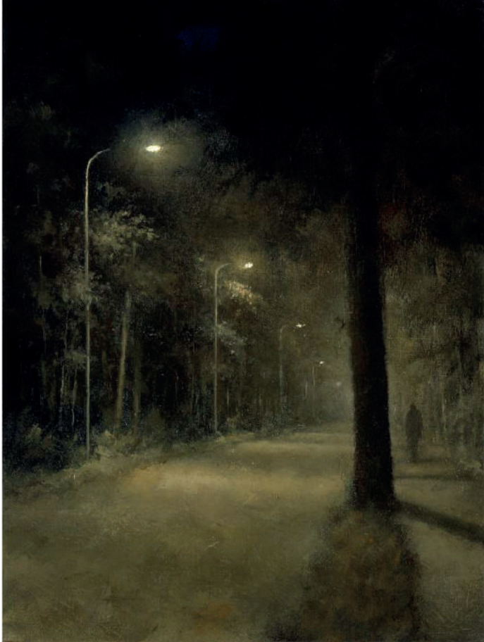
Stille Zaterdag – 16 april 2022 In afwachting van Pasen